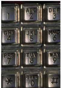
Didascalia dell'immagine o della fotografia

Inserire informazioni dettagliate sull'organizzazione e una breve descrizione di prodotti o servizi specifici nelle facciate interne. Il testo deve essere incisivo in modo da attirare l'attenzione del lettore.