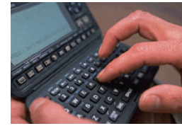
Didascalia dell'immagine o della fotografia

bortis nisl ut aliquip ex en commodo consequat. Duis te feugifacilisi per suscipit lobortis nisl ut aliquip ex en commodo consequat.